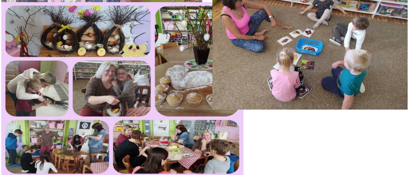
Velikonoční dílničky pro rodiče s dětmi – výroba